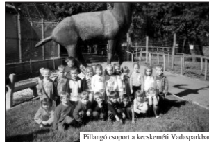
Pillangó csoport a kecskeméti Vadasparkban

Az elmúlt két hónapban kedvezett az időjárás óvodásainknak. Számos őszi programot szerveztünk gyermekeinknek. Három csoportot szüretelni vittünk szülői segítséggel. A Szilfa Tagóvoda gyermekei tökszüretben vettek részt egyik szülő kezdeményezésére. A nagyobbak elsétáltak a piacra, ahol megszemléltek az őszi gyümölcsöket és zöldségféléket. Négy csoportunk a vonatozás élményével gazdagodott, többen közülük most ültek először ezen a járművön. Színházlátogatást szerveztünk Dunaujvárosba és Dunaföldvárra. Két csoportunk Kecskeméten a Círóka bábszínházban nézett meg egy mese