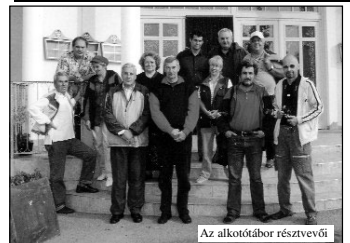
Az alkotótábor résztvevői

STIHL fűrészek, alnövényzetsztítók, egyéb STIHL® gépek